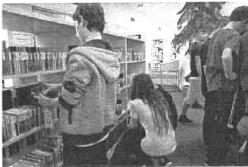
Ismerkedés a huszár múlttal